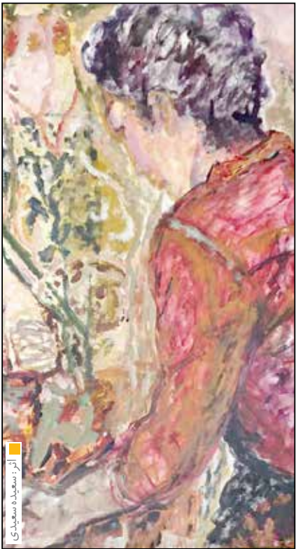
آثار زهره امیرحمانی