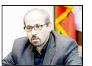
معاون امور اجتماعی و فرهنگی وزارت کار.

با این حال معاون امور اجتماعی و فرهنگی وزیر کار با رد وقت کشی از سوی وزارت کار، از تهیه مدل های جدید عملیاتی برای تسهیل تامین مسکن گروه های مختلف کارگری خبری نداد. «ابراهیم صادقی فر» در گفت و گو با مهر، درباره آخرین وضعیت طرح «مسکن کارگری» که در جلسه اخیر شورای عالی کار مطرح شده بود، اظهار داشت: رویکرد اصلی مورد نظر در این طرح، تامین مسکن دست یافتنی و مقرون به صرفه متناسب با توان اقتصادی خانوارهای کارگری فاقد مسکن است.