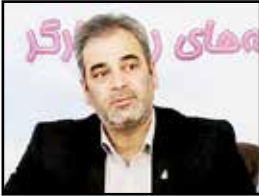
معاون امور اجتماعی و فرهنگی وزارت کار.

رئیس کانون عالی انجمن های صنفی کارگران افزود: یکی دیگر از پیشنهادات ما بحث اجاره به شرط تملیک بود و معتقدیم می توان این شیوه را عملی و از طریق آن جامعه کارگری را خانه دار کرد. امروز هزینه مسکن و اجاره بها در شهرهای بزرگ و کوچک افزایش پیدا کرده و بیشتر دریافتی کارگران بابت اجاره بها یا خانه می رود. به اعتقاد عالی کار این است که حرفی برای گفتن و برنامه ای برای اجرا نیست. اینکه یک حکم صادر شود و اعلام کردیم که در این هفته در نشست شورای عالی کار مقرر شد دو هفته بعد جلسه دیگری تشکیل دهیم تا دیدگاه های دوطرف به جمع بندی برسد. ما به تعهداتمان عمل کردیم و با پیشنهاد هم به جلسه رفته بودیم با این حال اعلام کردیم پیشنهادات تکمیلی خودمان را در جلسه بعد ارائه می کنیم ولی اکنون وارد هفته سوم شده ایم و همچنان منتظر حضور در شورا هستیم.