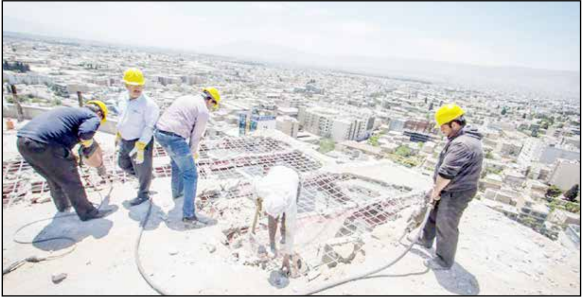
کارگران در حال کار در یک پروژه مسکن کارگری.

دوبست و هشتاد و پنجمین نشست شورای عالی کار با محور بررسی راهکارهای تقویت تعاونی های مسکن و مصرف کارگران و سازو کارهای تامین مسکن مشارکتی، دوم مهر ماه با حضور سه معاون وزیر تعاون، کار و رفاه اجتماعی، برگزار و مقرر شد تا ظرف دو هفته بعد دو گروه کارگری و کارفرمایی، پیشنهادات و دیدگاههای خود را درباره تامین مسکن کارگران مطرح کنند اما جلسه بعدی به دلیل آنچه که نمایندگان کارگری وقت کشی می نامند، تا امروز برگزار نشده است.