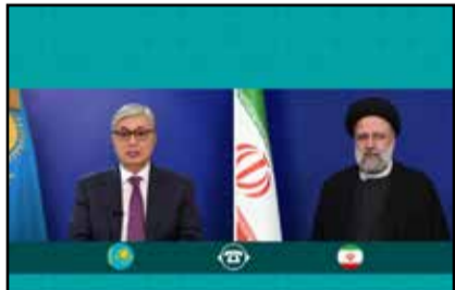
مشترک همکاری های اقتصادی و نیز سفرهای دو جانبه بتواند جهشی بلند در روابط دو کشور ایجاد کند.