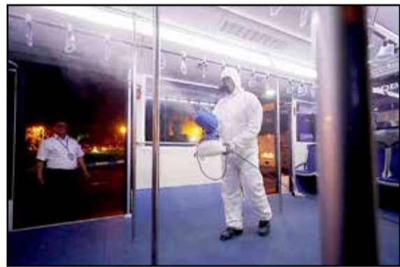
مردی در حال ضد عفونی کردن یک مکان در جزیره کیش.

می‌توانند به مشتری سرویس ارائه دهند که در قالب بیرون بر فعالیت کنند و پذیرش مشتری جهت سرو غذا در محل رستوران و کافی‌شاپ خودداری کنند. وی افزود: در راستای جلوگیری از تجمع ساکنین در اماکن عمومی تا اطلاع ثانوی تمامی کافی‌شاپ‌ها تعطیل هستند. رضائیا خاطر نشان کرد: اماکن نیروی انتظامی جزیره کیش بر فعالیت بیرون بر بودن رستوران‌ها، فست‌فودها و تعطیلی کافی‌شاپ‌ها، املاک و نمایشگاه‌های خودرو به صورت جدی نظارت مستمر خواهد داشت. وی در خصوص رعایت ضوابط بهداشتی و اعمال تمهیدات لازم از پیشگیری بیماری کرونا در بخش‌های دولتی و خصوصی؛ اظهار داشت: تمامی مدیران دولتی، بانک‌ها، موسسات مالی و اعتباری، شرکت‌های دولتی و خصوصی مکلف هستند تدابیر لازم را برای کاهش مراجعات مردمی به این ادارات در نظر گرفته و نسبت به ضد عفونی و مراقبت افراد در این اماکن اقدام کنند. محمدرضا رضائیا بر لزوم نظارت مستمر شرکت ملی پخش فرآورده‌های نفتی در جایگاه‌های سوخت جزیره کیش اشاره داشت و افزود: شرکت ملی پخش فرآورده‌های نفتی مکلف هستند نظارت بر عملکرد صحیح پمپ بنزین در خصوص سوخت‌گیری توسط اپراتورها یا وجود حفاظت فردی نظیر دستکش