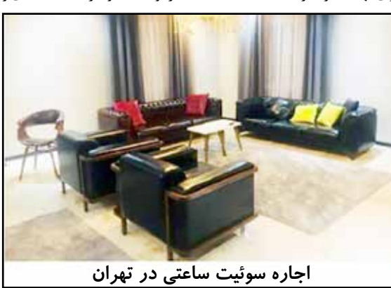
اجاره سوئیت ساعتی در تهران

اظهارات سرهنگ اسفندیاری در حالی است که طبق آمار سال ۹۵ از تمام واحدهای مسکونی در تهران ۱۳ درصد آن خالی از سکنه است. به گزارش ایسنا، براساس سرشماری نفوس و مسکن سال ۱۳۹۵ در استان تهران سه میلیون و ۸۹۰ هزار واحد مسکونی وجود دارد که ۴۹۰ هزار واحد معادل ۱۳ درصد از این تعداد خالی است و با توجه به رکود ساخت‌وساز احتمالاً تعدادی از