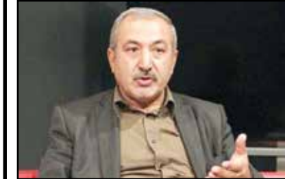
اجرای کشور تحلیل خواهد رفت و در نهایت دودش به چشم مردم خواهد رفت.

رئیس‌جمهور در دیدار «لی جان شو»، رئیس‌کنگره ملی خلق چین، ایران و چین را دوستان دوران سخت توصیف و از حمایت‌های سازنده کنگره ملی خلق چین در جهت گسترش همکاری‌های دو کشور قدر دانی کرد. رئیسی با تأکید بر اهمیت نقش همکاری‌های پارلمانی بر روند توسعه همکاری‌های دو جانبه، از حمایت‌های سازنده کنگره ملی خلق چین در جهت پیشبرد روابط راهبردی ایران