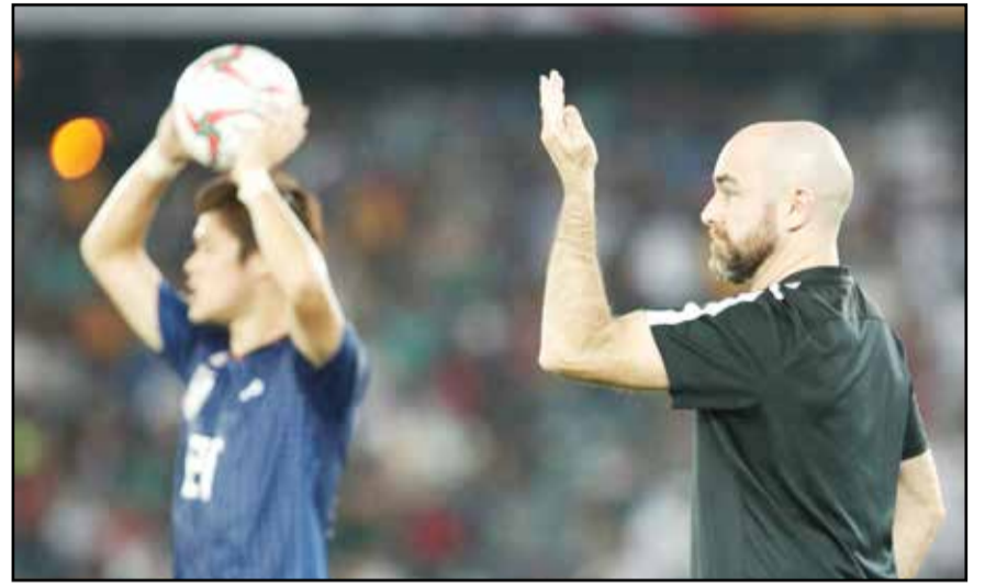
آر یار هنورد

نگاهی به تفاوت سرمایه گذاری ایران و قطر در فوتبال